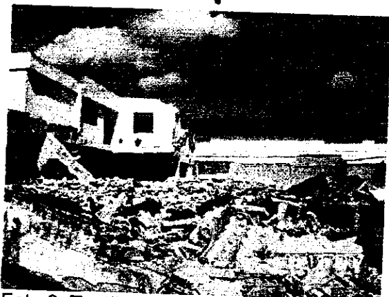
Foto 3. Textiles SAAB- Vista interna