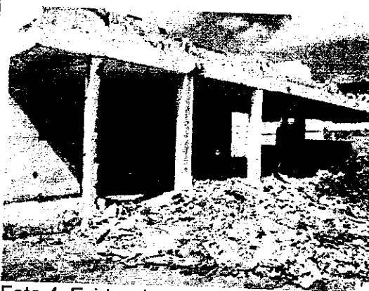
Foto 4. Evidencias del abandono.