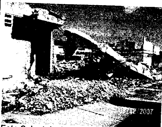
Foto 2. Instalaciones deterioradas